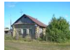
Дома постройки начала XVIII в.