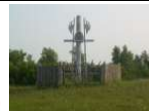
Знак на месте высадки отряда князя А.Елецкого в Усть-Таре