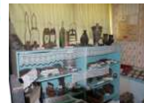
Бережно сохраняемая старинная утварь