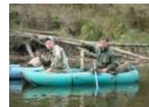
Богатая рыбалка на таежных речках

Проект Западно-Сибирского национального парка имени Ермака (Омская область) разработан для сохранения природных комплексов, имеющих особую экологическую, историческую, эстетическую ценность в силу благоприятного сочетания естественных и культурных ландшафтов, и использования их в рекреационных, просветительных, научных и культурных целях