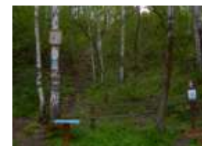
Места религиозного паломничества к освященным источникам