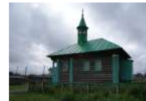
Старинная татарская мечеть в с.Черталы